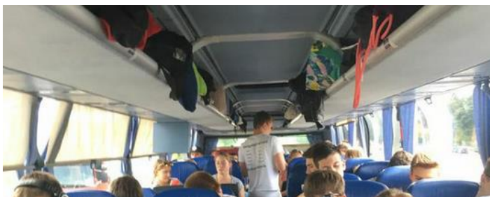
Busfahrt nach Görlitz