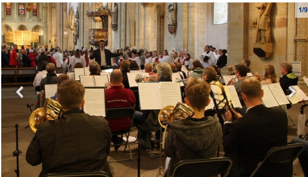
Das Eröffnungskonzert des Deutschen Musikfestes findet im Osnabrücker Dom statt.